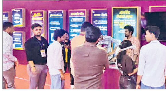
सिरसा। महिला सशक्तिकरण पर आधारित प्रदर्शनी का अवलोकन करते युवा।

सूचना एवं जनसंपर्क अधिकारी ने सोमवार को बताया कि प्रदर्शनी को विभिन्न राज्यों से विश्वविद्यालय में पहुंचे युवाओं ने प्रदर्शनी देखी और इसकी सराहना करते हुए कहा कि तकनीकी अनुभव से प्रदर्शनी को आधुनिक और इंटरएक्टिव स्वरूप मिला है, इससे युवाओं और विद्यार्थियों में काफी उत्साह है। प्रदर्शनी के माध्यम से यह संदेश दिया गया है कि आज बेटियां खेल, विज्ञान, तकनीक, प्रशासन और समाज सेवा सहित हर क्षेत्र में अपनी नई पहचान बना रही हैं। सरकार की नीतियों, समाज के सहयोग और प्रतिभा के बल पर हरियाणा आज प्रदर्शनी में महारी बेटियां-महारा गौरव थीम के माध्यम से हरियाणा की प्रतिभाशाली बेटियों की सफलता की कहानियों को दर्शाया गया है।