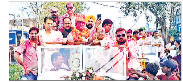
सिरसा। जिला स्वर्णकार संघ के प्रधान चुने जाने जीत की खुशी मनाते।