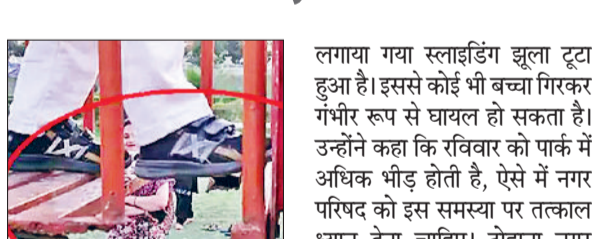
टोहाना। टाउन पार्क में टूटे झूले।

शहर के हिसार रोड पर स्थित टाउन पार्क में लगे टूटे झूले हादसों का कारण बन सकते हैं। नगर परिषद द्वारा इस ओर कोई ध्यान नहीं दिया जा रहा है, जिससे कभी भी कोई बड़ा हादसा हो सकता है। पार्क में आने वाले लोगों ने नगर परिषद प्रशासन से इन झूलों की जल्द