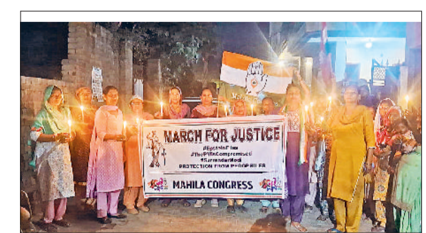
शहर में कैडल मार्च निकालते महिला कांग्रेस कार्यकर्ता।

अपने विभागों द्वारा किए जा रहे कार्यों और योजनाओं की प्रगति रिपोर्ट प्रस्तुत की।