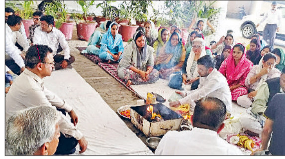
सिरसा। सीडीएलयू में हवन यज्ञ करते हुए कुलपति व अन्य।