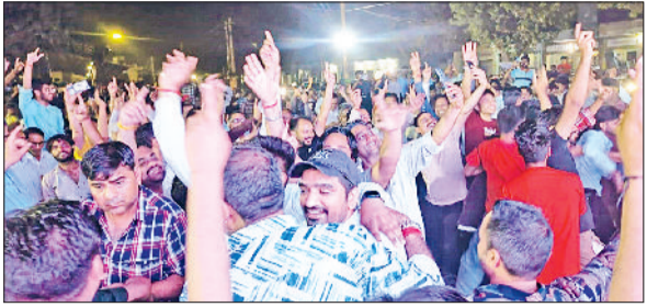
रतिया। फाइनल में भारत की जीत पर खुशियां मनाते क्रिकेट प्रेमी।

टी-20 वर्ल्डकप में भारत और न्यूजीलैंड के बीच रविवार देर शाम खेले गए रोमांचक फाइनल क्रिकेट मैच को लेकर जिलेभर में भारी उत्साह देखने को मिला। फतेहाबाद के हुडा सैक्टर, सोमा सिटी, स्कॉलर स्कूल सहित अनेक जगहों पर बड़ी स्क्रीन पर मैच का लाइव प्रसारण हुआ। यहां मैच देखने के लिए काफी संख्या में खेल प्रेमियों की भीड़ जुटी। जैसे ही भारतीय टीम ने न्यूजीलैंड पर जीत दर्ज की, क्रिकेट प्रेमियों ने जमकर जश्न मनाया शुरू कर दिया। जमकर आतिशबाजी की गई। फतेहाबाद के अलावा रतिया में श्री नीलकंठ महादेव कावड़ संघ द्वारा अनाज मंडी में एक विशाल एलईडी स्क्रीन लगाई गई,